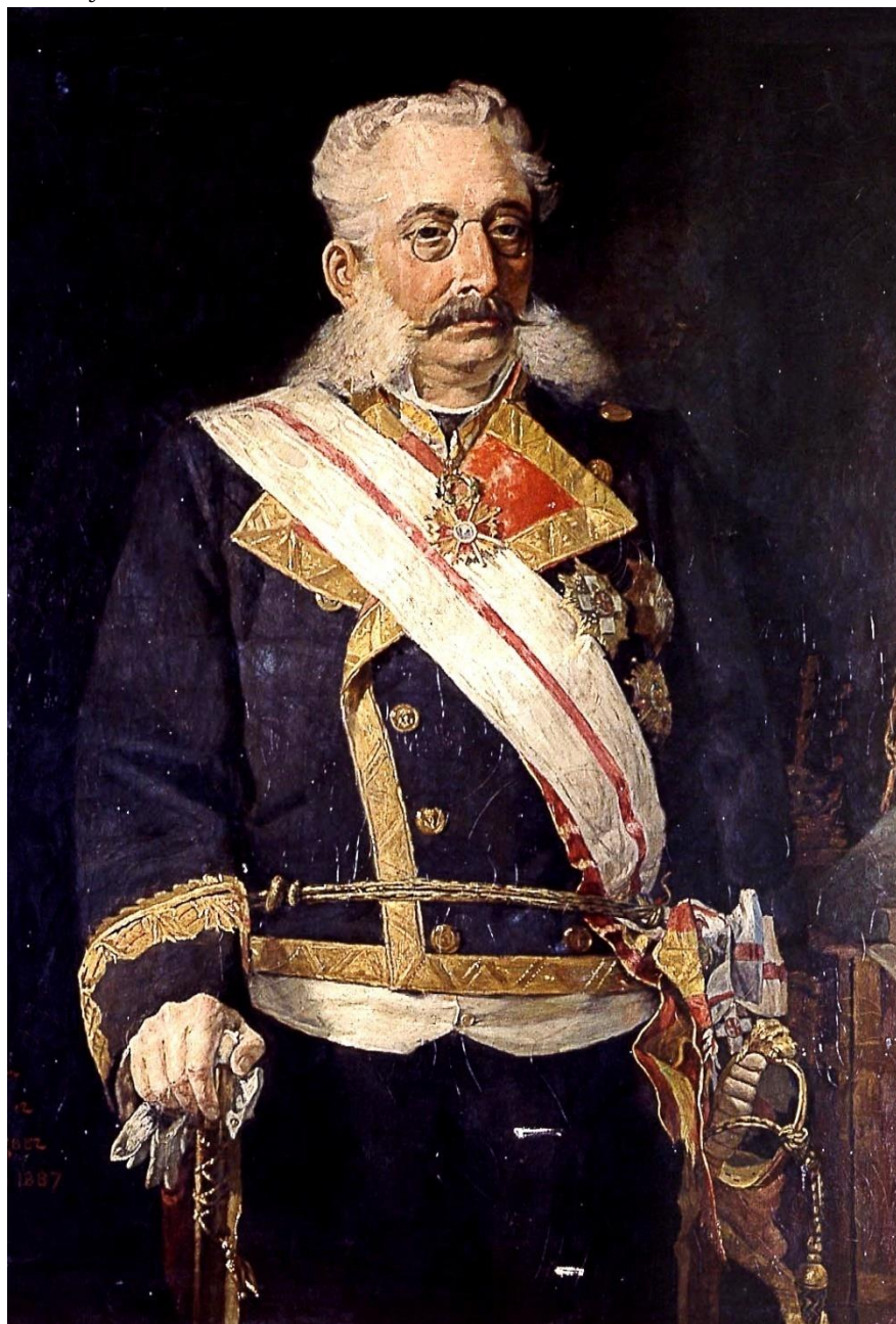
Óleo pintado Rodríguez año 1887. Policlínica Naval en Madrid nº inv 5544