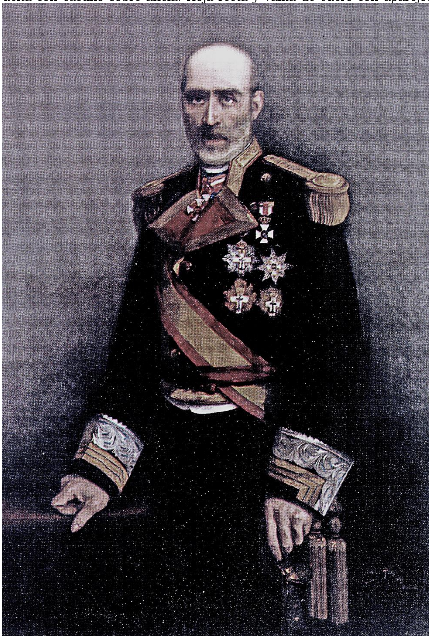
Óleo pintado por Cecilio Pla, Madrid 1889. Museo Naval de Madrid n° inv. 5634