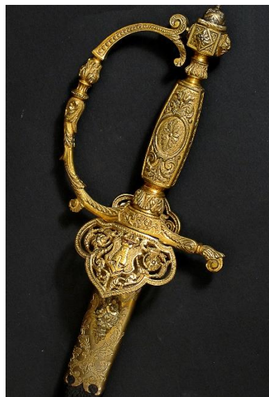
ESPADA DE CEÑIR Oficial Ingenieros de la Armada Libro ESPADAS ESPAÑOLAS, por Vicente Toledo