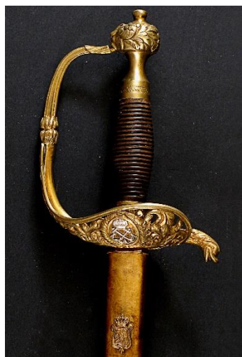
ESPADAS DE CEÑIR Jefes y oficiales de Infantería de Marina, modelo 1869 Libro ESPADAS ESPAÑOLAS, por Vicente Toledo