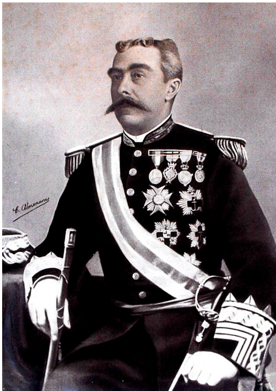
Fotografía del Tercio de Armada