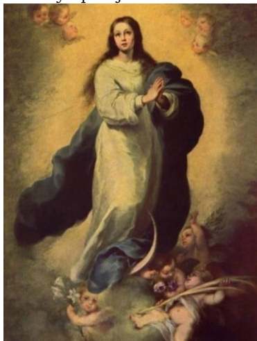
La Purísima Concepción patrona del Cuerpo de Estado Mayor

Lleva una espada de ceñir modelo 1861 para jefes y oficiales de Estado Mayor. Guarnición totalmente de latón dorado, con gavilanes rectos y en el centro, el emblema del Cuerpo. Hoja recta con vaina de cuero y aparejos de latón dorado también.