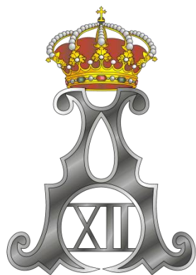
Monograma del rey Alfonso XII "AXII"

Sable modelo 1860 para oficial de caballería ligera. La guarnición de tipo prusiano, cazoleta cerrada de hierro con puño de madera forrado de piel y alambrado de hilo de cobre. Hoja curva y vaina de hierro con dos abrazaderas.