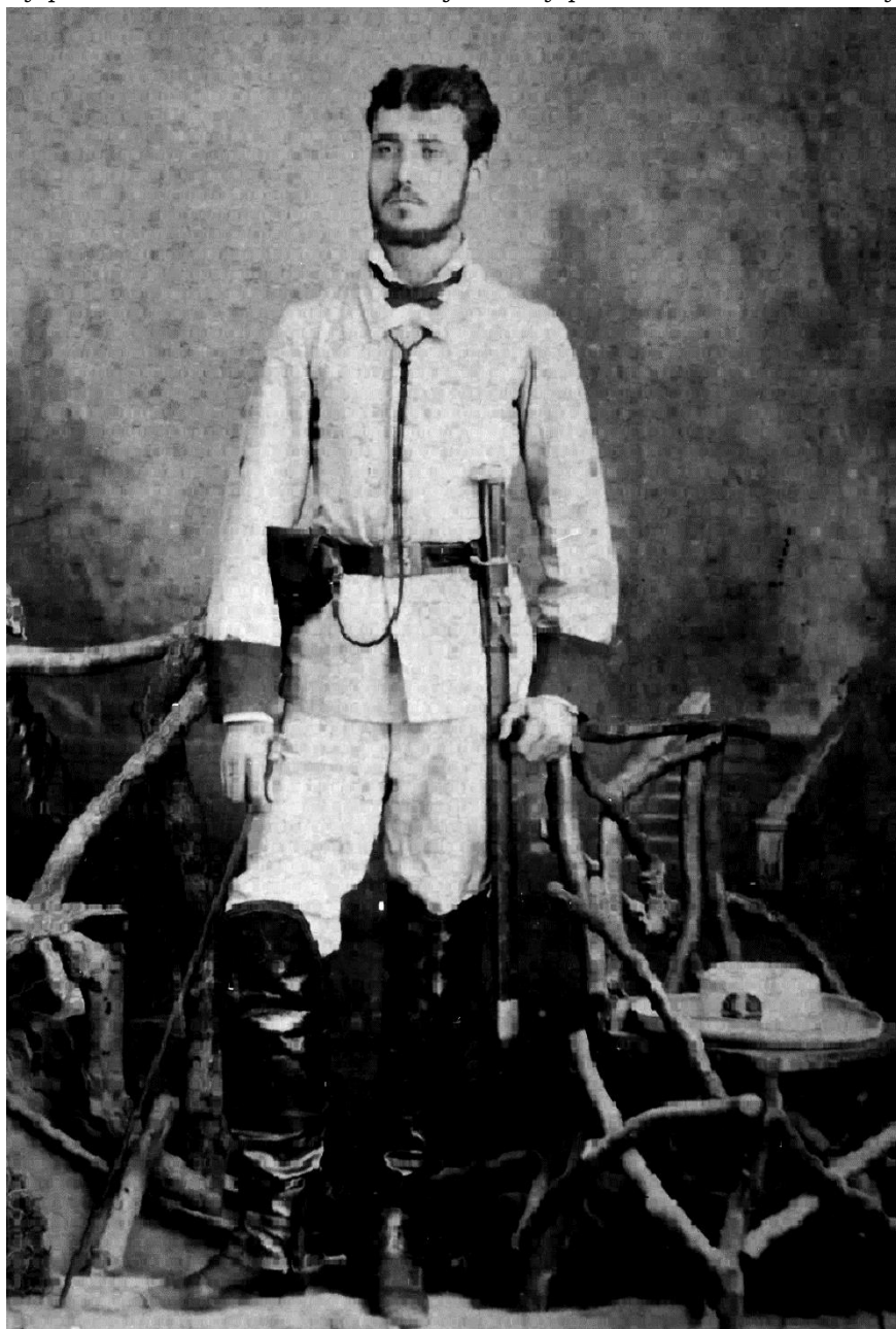
Fotografía del Tercio de Armada

Ejército Español en Cuba Libro ESPADAS ESPAÑOLAS, por Vicente Toledo