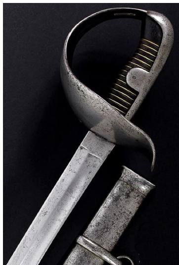
SABLE Tropa Caballería Ligera modelo 1860 Libro ESPADAS ESPAÑOLAS, por Vicente Toledo