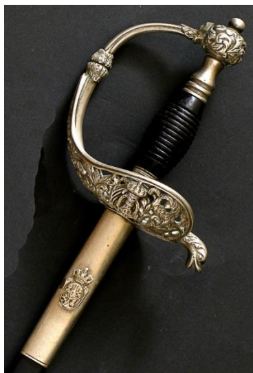
ESPADA DE CEÑIR oficial del Cuerpo de Ingenieros modelo 1860 Libro ESPADAS ESPAÑOLAS, por Vicente Toledo