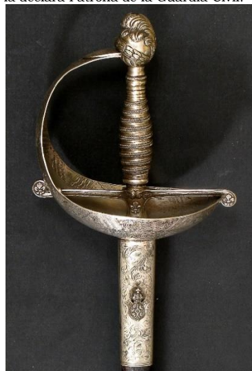
ESPADA hacia 1844

Libro ESPADAS ESPAÑOLAS, por Vicente Toledo