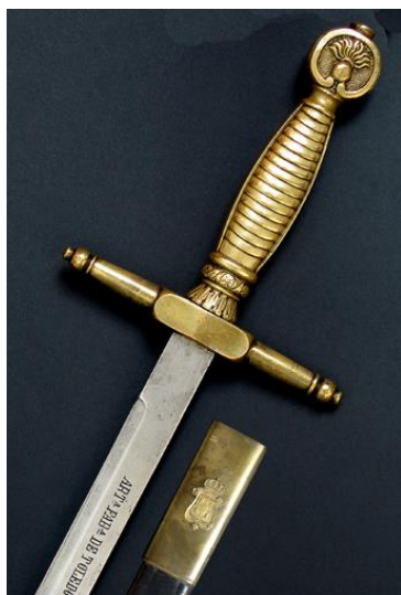
MACHETE Músicos Militares modelo 1860 Libro ESPADAS ESPAÑOLAS , por Vicente Toledo