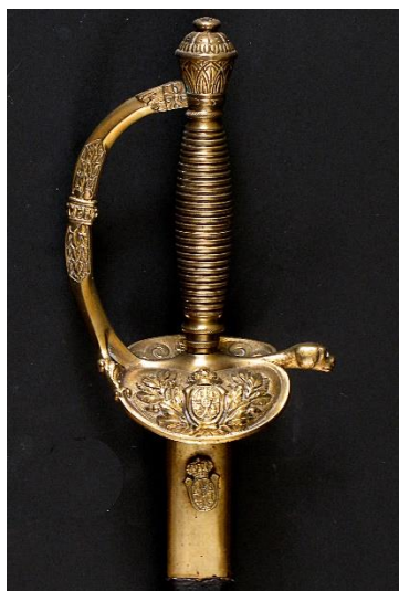
ESPADA DE CEÑIR

“El Ejército Español en Ultramar y África”