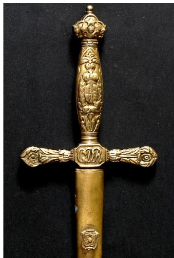
ESPADÍN Oficial Carabineros del Reino Modelo 1869 Libro ESPADAS ESPAÑOLAS, por Vicente Toledo