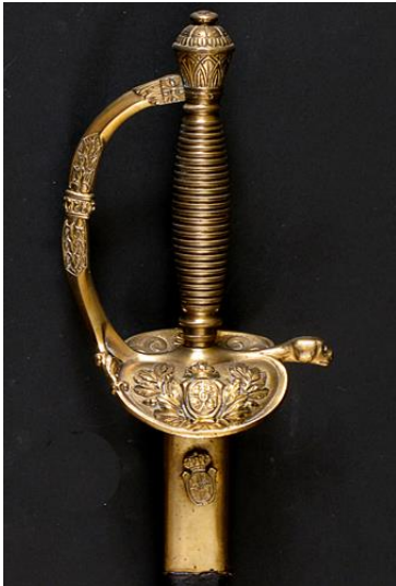
ESPADA DE CEÑIR oficial de Infantería modelo 1867 Libro ESPADAS ESPAÑOLAS, por Vicente Toledo