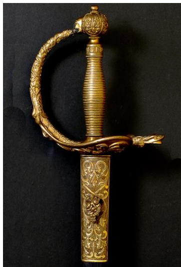
ESPADAS DE CEÑIR para General, modelo 1870 Libro ESPADAS ESPAÑOLAS, por Vicente Toledo