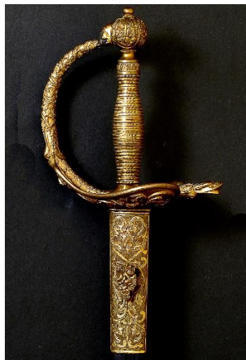
ESPADA DE CEÑIR para General, modelo 1870 Libro ESPADAS ESPAÑOLAS, por Vicente Toledo