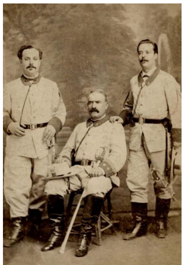
Teniente Coronel y oficiales del Regimiento nº 5

Sable modelo 1851 para jefes y oficiales de Infantería. Guarnición dorada, con un gavilán y cazoleta con el escudo de España, puño forrado con piel de lija y alambrado con torzal de hilo de cobre. Hoja ligeramente curva y la vaina metálica con dos abrazaderas y sus correspondientes anillas.