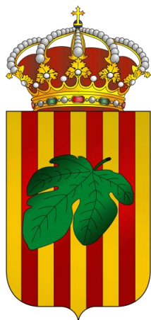
Emblema del Batallón de Cazadores de Figueras nº 8

Sable modelo 1851 para jefes y oficiales de Infantería. Guarnición dorada, con un gavlán y cazoleta con el escudo de España, puño forrado con piel de lija y alambrado con torzal de hilo de cobre. Hoja ligeramente curva y la vaina metálica con dos abracaderas y sus correspondientes anillas.