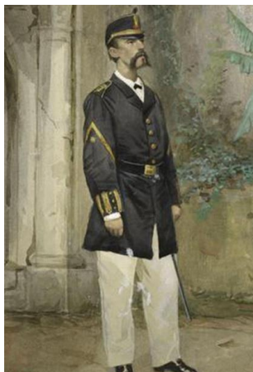
Oficial en Cuba. Ilustración de 1862

Sable modelo 1851 para jefes y oficiales de Infantería. Guarnición dorada, con un gavilán y cazoleta con el escudo de España, puño forrado con piel de lija y alambrado con torzal de hilo de cobre. Hoja ligeramente curva y la vaina metálica con dos abrazaderas y sus correspondientes anillas.