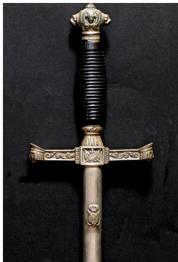
ESPADAS DE CEÑIR Oficial de Caballería, modelo 1851 Libro ESPADAS ESPAÑOLAS, por Vicente Toledo