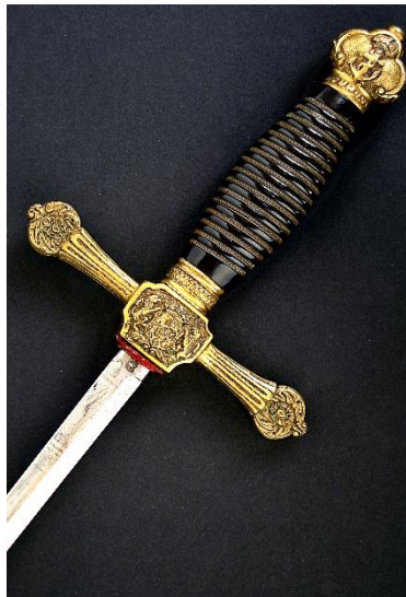
ESPADA DE CEÑIR Jefes y oficiales de la Armada hacia 1843 Libro ESPADAS ESPAÑOLAS, por Vicente Toledo