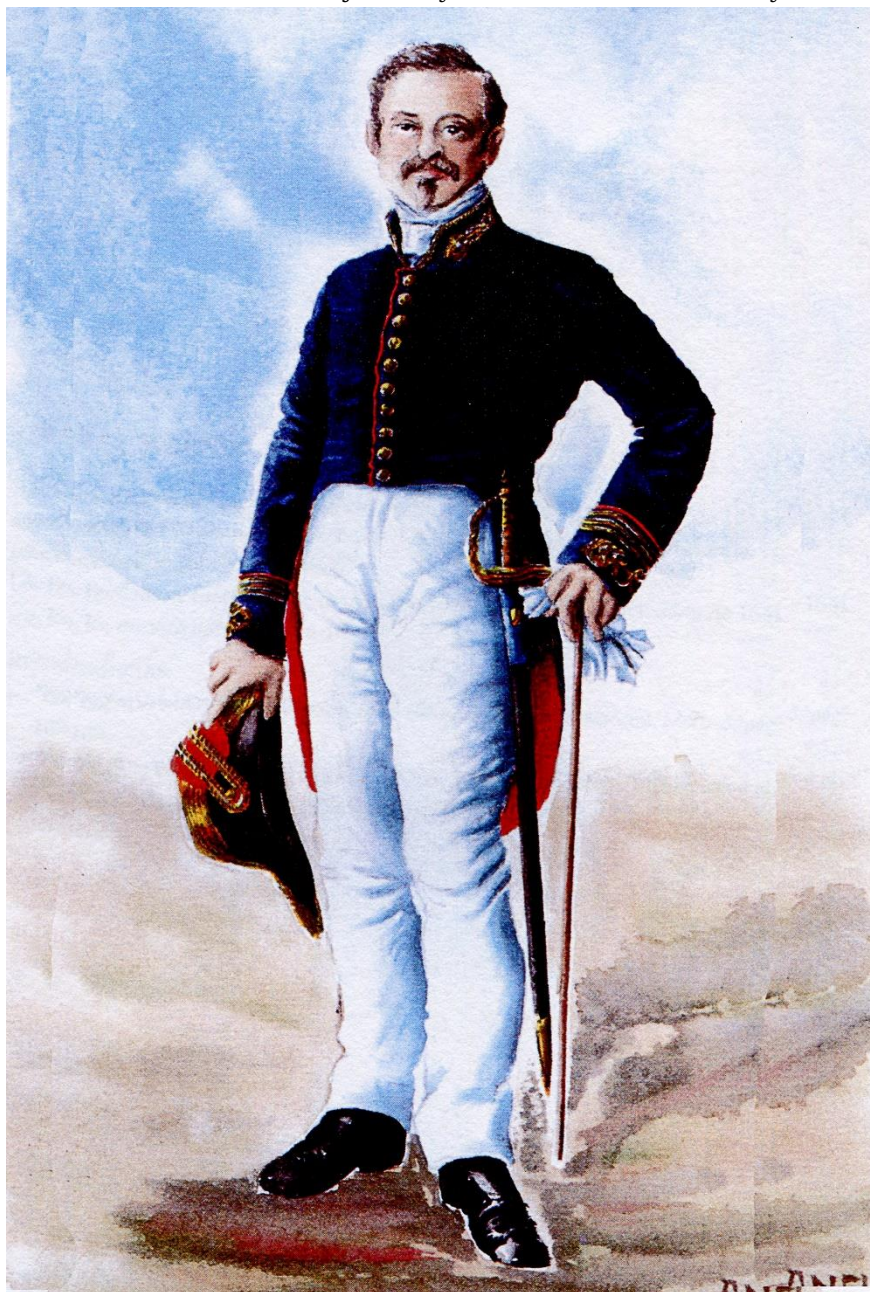
Ilustración realizada por ANEL

Libro ESPADAS ESPAÑOLAS, por Vicente Toledo