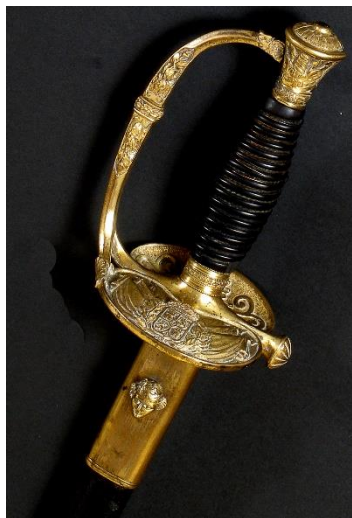
ESPADA DE CEÑIR Circa 1816-40

Libro ESPADAS ESPAÑOLAS, por Vicente Toledo