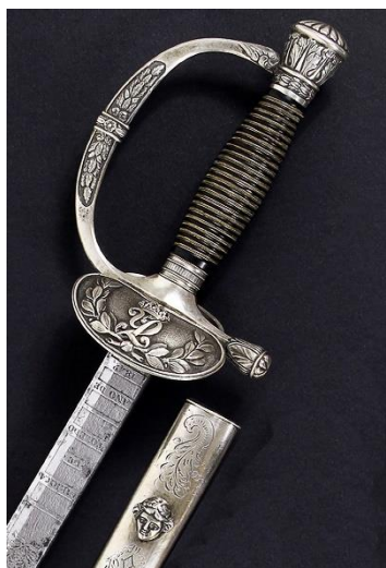
ESPADAS DE CEÑIR Para Brigadier modelo 1840 Libro ESPADAS ESPAÑOLAS, por Vicente Toledo