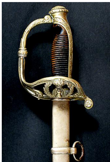
SABLE Oficial de Ingenieros modelo 1860 Libro ESPADAS ESPAÑOLAS, por Vicente Toledo