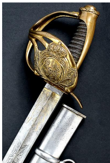
SABLE hacia 1825 Libro ESPADAS ESPAÑOLAS , por Vicente Toledo