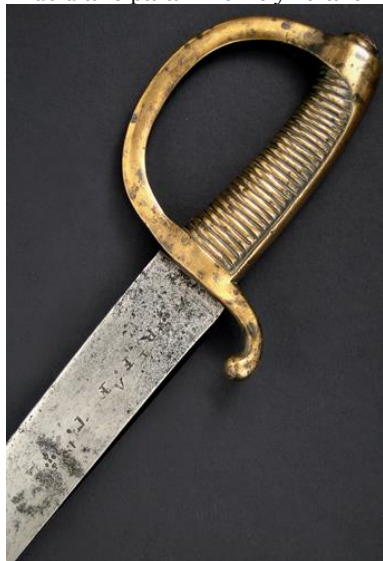
SABLE Tropa de Infantería modelo 1818 Libro ESPADAS ESPAÑOLAS, por Vicente Toledo