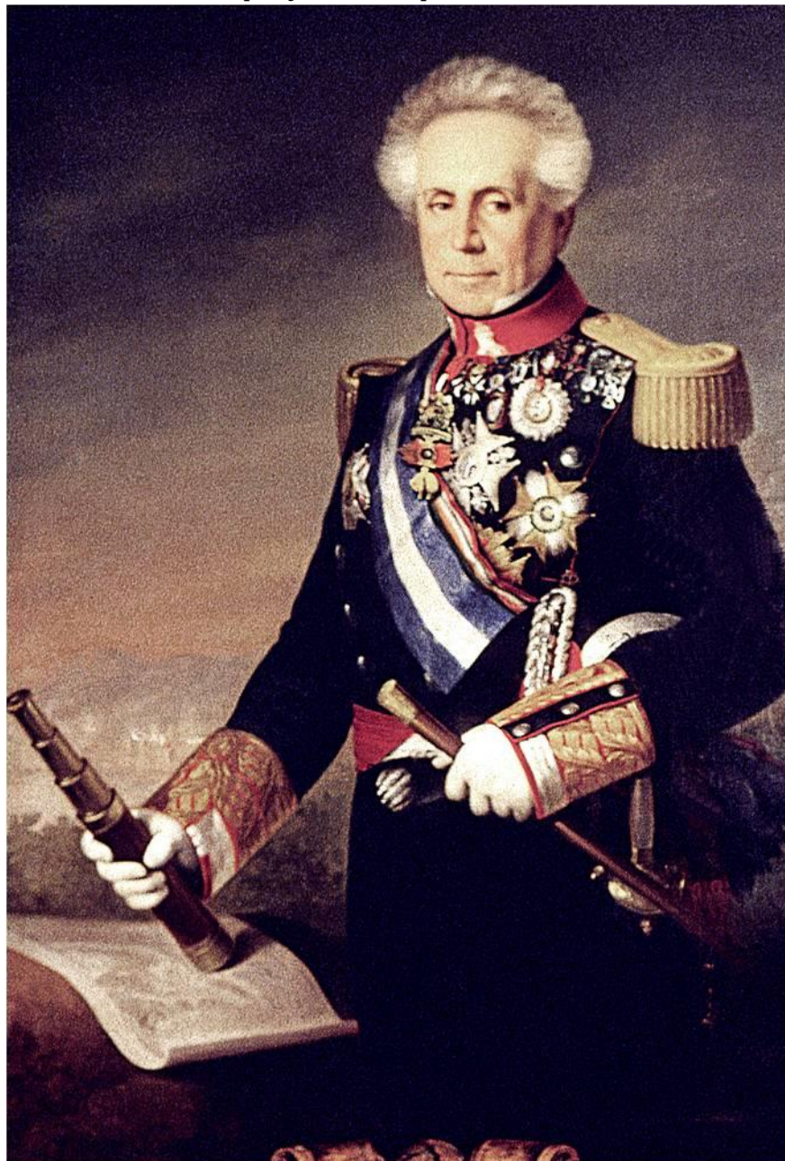
Óleo del Museo del Ejército