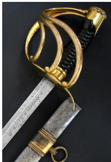
ESPADAS DE MONTAR Oficial del R. C. Guardias de la Persona del Rey, hacia 1816 Libro ESPADAS ESPAÑOLAS, por Vicente Toledo