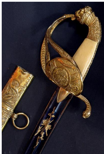
SABLE Oficiales de la Armada hacia 1810 Libro ESPADAS ESPAÑOLAS, por Vicente Toledo