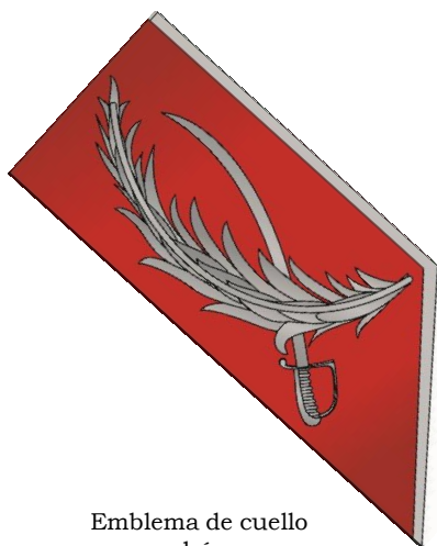
Emblema de cuello para húsares.

El sable donde se apoya no es reglamentario, es similar al de la foto inferior. Guarnición dorada con cazoleta y tres gavilanes, monterilla corrida y puño de madera forrado de piel y alambrado con hilo de cobre. Hoja curva y vaina metálica con dos anillas.