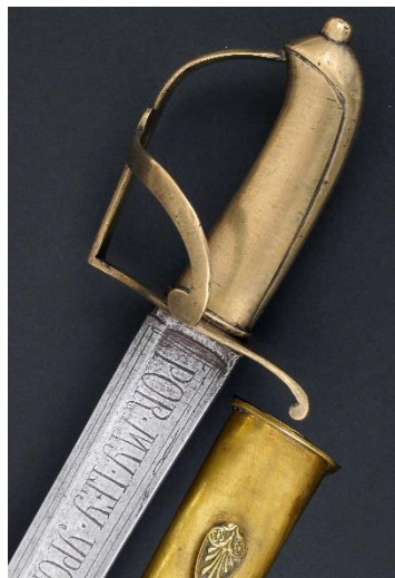
SABLE Para granaderos Libro ESPADAS ESPAÑOLAS, por Vicente Toledo