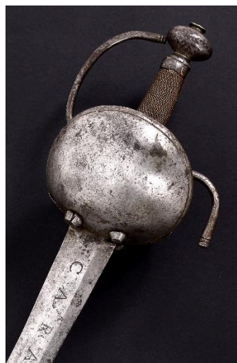
ESPADA Tropa de Carabineros Reales Libro ESPADAS ESPAÑOLAS, por Vicente Toledo