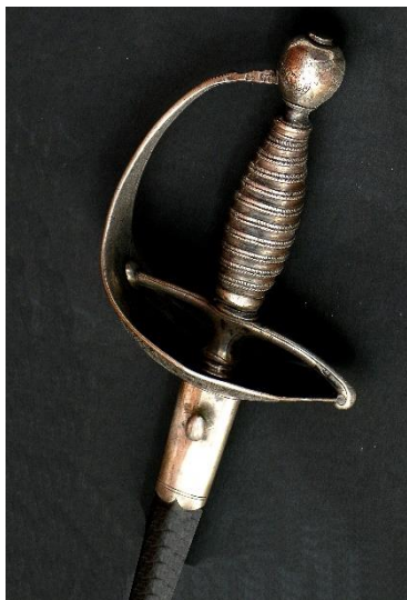
ESPADAS Siglo XVIII Libro ESPADAS ESPAÑOLAS, por Vicente Toledo