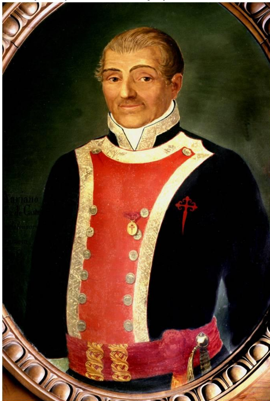
Óleo de la colección del Museo del Ejército