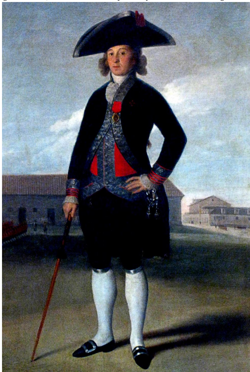
"Manuel Delapeña, 1799" pintado por Francisco de Goya y Lucientes, se encuentra en The Hispanic Society of America