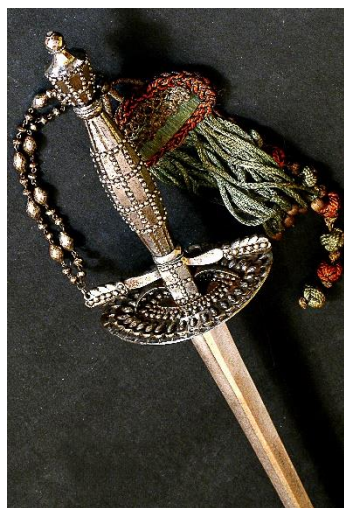
ESPADÍN DE CAZOLETA Siglo XVII Libro ESPADAS ESPAÑOLAS, por Vicente Toledo