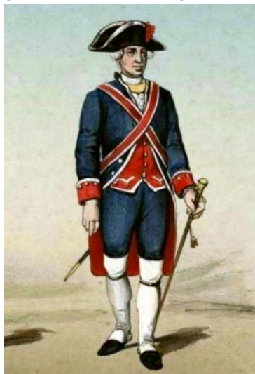
Oficial de Alabarderos con bastón de mando

La espada usada por los Alabarderos desde finales del siglo XVIII tiene la “cazoleta de barquilla” con guarnición de acero, gavilanes rectos, pomo, puño alambrado con hierro, recazo y hoja recta.