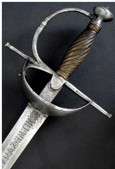
ESPADA Siglo XVIII

Libro ESPADAS ESPAÑOLAS, por Vicente Toledo