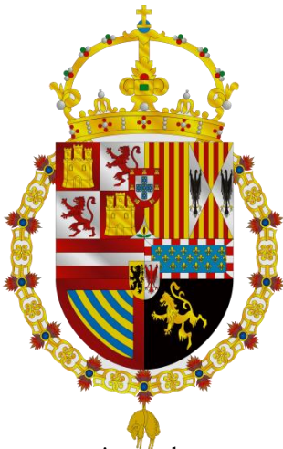
Armas de S.M. el rey Felipe IV

Lleva una preciosa espada, de las llamadas de lazo, muy similar a la de la fotografía inferior de gran prestancia y señorío. Guarnición dorada con un gran pomo equilibrador, puño alambrado, escudete con recazo, guardamano, gavilanes rectos y otros protectores de la mano. Hoja recta y larga.