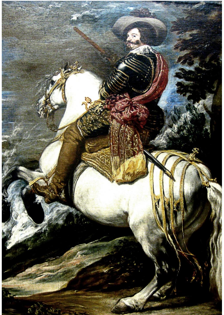
“Don Gaspar de Guzmán, Conde Duque de Olivares” pintado por D. Diego Rodríguez de Silva y Velázquez, entre 1587 y 1645. Este óleo se encuentra en “The Hispanic Society of America”.