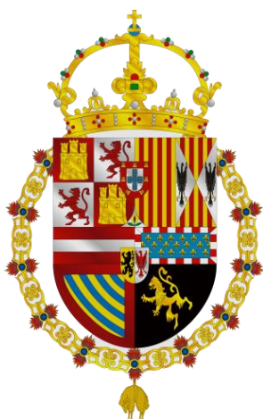
Armas del rey Felipe II

Las espadas de los mandos eran de mejor calidad y acabado que las de la tropa, encontrando en esa época verdaderas obras de arte, ya que contábamos con grandes espaderos en Toledo, Valencia y otras ciudades a lo largo de la península.