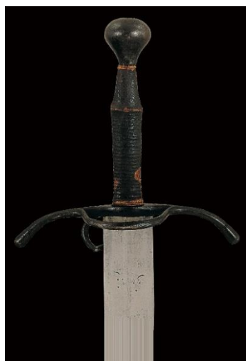
ESPADA ESTOQUE Siglo XVI Libro ESPADAS ESPAÑOLAS, por Vicente Toledo