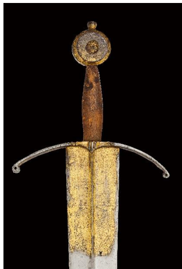
ESPADA ESTOQUE El Señor es mi ayuda... Siglo XV Libro ESPADAS ESPAÑOLAS, por Vicente Toledo