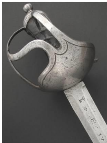
ESPADA Tropa Dragones modelo 1768

Ambos soldados llevan una espada de hoja recta y guarnición de acero, con cazoleta cerrada, aro y dos gavilanes. El puño es de madera forrado de piel. La vaina de cuero con brocal y contera metálicos.