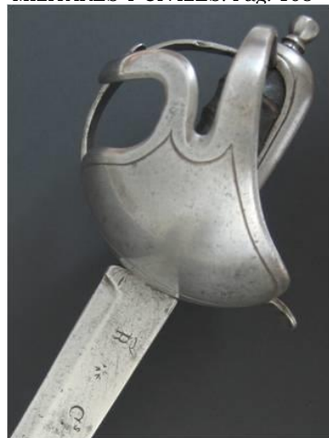
ESPADA Tropa Caballería hacia 1803

Libro ESPADAS ESPAÑOLAS, MILITARES Y CIVILES. Pág. 108