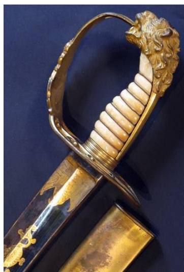
SABLE hacia 1825 Libro ESPADAS ESPAÑOLAS. MILITARES Y CIVILES. Pág. 285