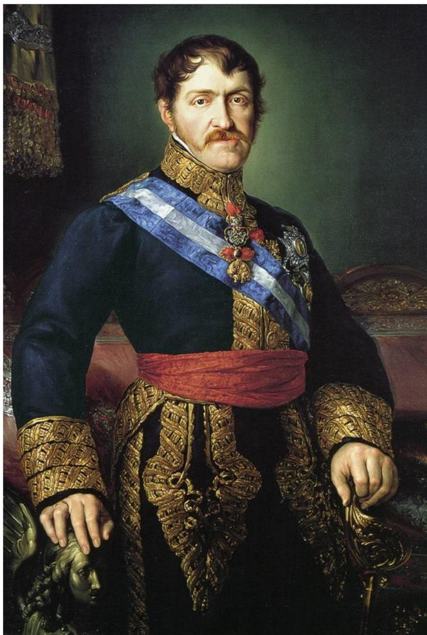
"Retrato de D. Carlos María Isidro de Borbón" Óleo pintado por Vicente López. (Real Academia de Bellas Artes de San Fernando.)