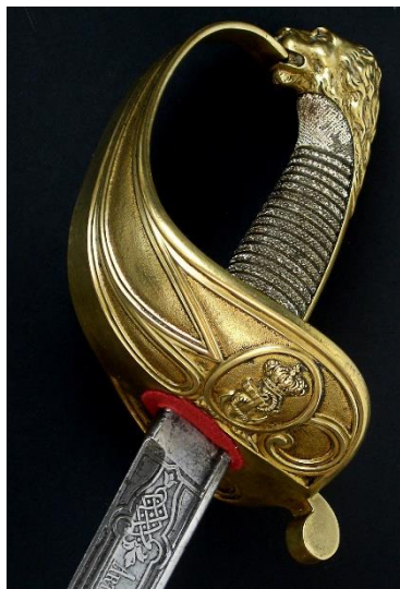
SABLE Jefes y oficiales de la Armada, modelo 1844 Libro ESPADAS ESPAÑOLAS, MILITARES Y CIVILES. Pág. 304