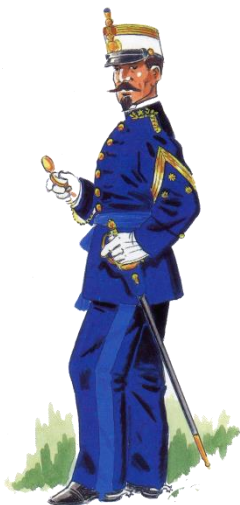
Capitán de diario a pie Ilustración de D. José M a Bueno

Lleva una espada de ceñir modelo 1861 para jefes y oficiales de Estado Mayor. Guarnición totalmente de latón dorado, con gavilanes rectos y en el centro, el emblema del Cuerpo. Hoja recta con vaina de cuero y aparejos de latón dorado también.