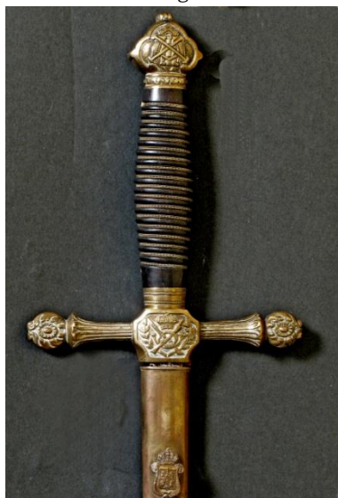
ESPADÍN oficial Infantería, modelo 1901 Libro ESPADAS ESPAÑOLAS, MILITARES Y CIVILES. Pág. 204