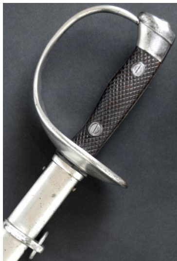
ESPADA-SABLE P.S. Jefes y oficiales de Infantería modelo 1909 Libro ESPADAS ESPAÑOLAS. MILITARES Y CIVILES. Pág. 218