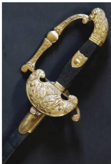
ESPADA DE CEÑIR Jefes y oficiales de Artillería. hacia 1814 Libro ESPADAS ESPAÑOLAS, MILITARES Y CIVILES. Pág. 133