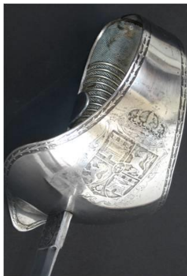
SABLE Oficial de Caballería modelo 1878 Libro ESPADAS ESPAÑOLAS, MILITARES Y CIVILES. Pág. 327