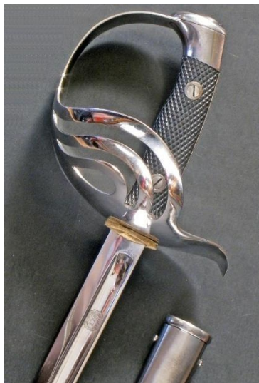
ESPADA DE MONTAR Jefes y oficiales del Escuadrón de la Escolta Real modelo 1910 Libro ESPADAS ESPAÑOLAS, MILITARES Y CIVILES. Pág. 220