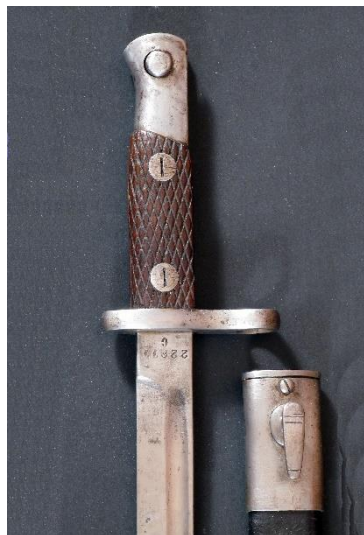
MACHETE-BAYONETA modelo 1913 Libro ESPADAS ESPAÑOLAS, MILITARES Y CIVILES. Pág. 416