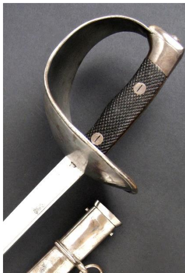
ESPADA-SABLE P.S. Para tropa de Caballería modelo 1907-18 Libro ESPADAS ESPAÑOLAS, MILITARES Y CIVILES. Pág. 210